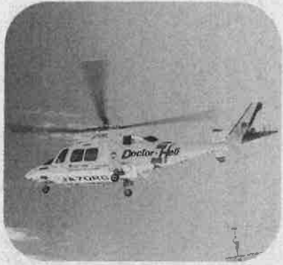
新潟県で2機目となる長岡赤十字病院に配備されたドクターヘリ